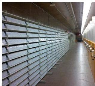
Les ressources documentaires numériques préservées au Centre de préservation, à Gatineau (Québec).

Pour garantir la pérennité du trésor numérique national dont il a la garde, BAC a préservé 1 234 téraoctets (To) de contenu numérique en 2019-2020, soit environ 99 millions de fichiers. L'étendue de la collection numérique préservée s'élève maintenant à 7 220 To, constitués entre autres de 5 420 To de fichiers vidéo, 373 To de microfilms et 119 To de fichiers audio.