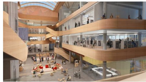
Place publique, vue vers l'est.

Au début de l'année 2020, inspirée par les suggestions du public, la conception de la future installation partagée xiv qui abritera les services de BAC et ceux de la Bibliothèque publique d'Ottawa a été dévoilée. Plus de 4 000 personnes ont pris part aux consultations qui ont guidé la conception architecturale xv . Clé de voûte de ce projet inédit, cette mobilisation réussie laisse présager un intérêt et un achalandage sans précédent dans ce nouveau lieu de culture et d'histoire à la fine pointe de la technologie, qui sera inauguré fin 2024, au 555, rue Albert, territoire traditionnel non cédé des Algonquins Anishinabeg.