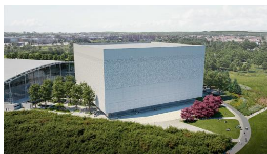
Rendu architectural de la nouvelle installation de préservation en construction derrière le Centre de préservation actuel à Gatineau (Québec).

Le projet d'infrastructure avant-gardiste destiné à préserver les trésors historiques et culturels du Canada pour les générations à venir a franchi deux étapes clés en 2019-2020. En juin, BAC et son collaborateur Plenary Properties Gatineau ont dévoilé la conception de la nouvelle installation de préservation, tandis qu'en août les travaux de construction étaient lancés. Notons aussi qu'en novembre, ce projet a remporté le prix Argent à l'occasion des Prix nationaux pour l'innovation et l'excellence en partenariats public-privé iv , décernés par le Conseil canadien pour les partenariats public-privé.