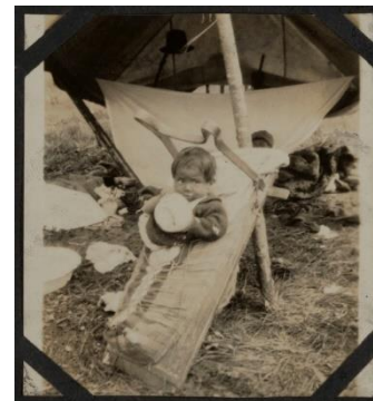
[Un bébé anishinaabe dans un tikinagan, Obishikokaang (Première Nation du Lac Seul), Ontario 1929]. Titre original : Lac Seul, mignon petit enfant, e011504802_s1

Grâce à l'initiative Nous sommes là : Voici nos histoires lxiii , qui vise à numériser et à décrire des centaines de milliers de documents liés aux Autochtones qui figurent dans les collections de BAC, 284 101 documents ont été numérisés en 2022-2023. L'initiative est donc en bonne voie d'atteindre son objectif de