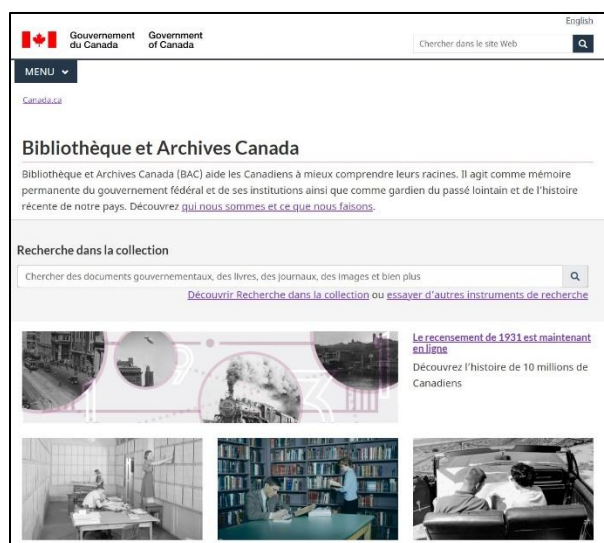
Site Web de BAC

Avec le but avoué de joindre et d'attirer davantage d'usagers de partout au pays, BAC a apporté plusieurs améliorations à l'accès virtuel à ses collections. Le design du site se veut visuellement attrayant et dynamique pour y attirer des publics de tout horizon, alors que la structure du site Web a été repensée afin d'être plus facile à suivre et mieux orienter les usagers.