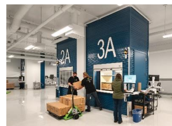
Des employés de BAC déménagent des boîtes

En parallèle, après des mois de préparation, BAC a commencé à déplacer les 590 000 contenants que le nouvel édifice doit abriter. Depuis janvier 2022, c'est plus de 391 536 contenants qui y ont dorénavant trouvé domicile, soit plus de 247 999 boîtes de documents textuels et 143 537 bobines de film.