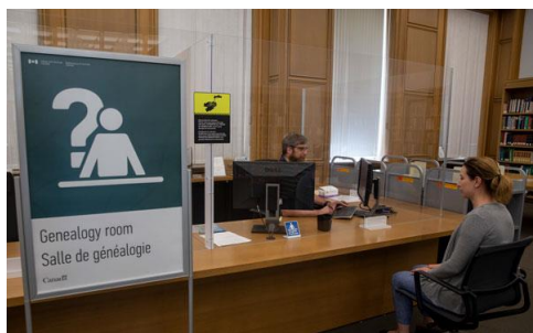
Un archiviste et une usagère dans la salle de généalogie du 395, rue Wellington, à Ottawa

Lorsque les mesures sanitaires liées à la COVID-19 ont été levées, BAC a repris toutes ses activités et rouvert les salles publiques de consultation et de recherche de tous ses points de service nationaux en juillet 2022. Cette année, BAC a effectué plus de 63 012 interactions en personne et à distance, soit autant de réponses et de conseils donnés aux personnes intéressées par ses collections, depuis ses points de service d'Ottawa, d'Halifax, de Winnipeg et de Vancouver.