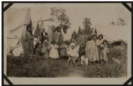
[Photo d'un groupe de femmes anishinaabes et de leurs enfants à l'époque des traités, Obishikokaang (Première Nation du Lac Seul), Ontario, 1929]. Titre original : Époque de la signature du traité, lac Seul, 1928, e011504804_s2

Grâce à l'initiative Nous sommes là : Voici nos histoires lxiii , qui vise à numériser et à décrire des centaines de milliers de documents liés aux Autochtones qui figurent dans les collections de BAC, 284 101 documents ont été numérisés en 2022-2023. L'initiative est donc en bonne voie d'atteindre son objectif de